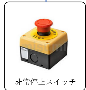
非常停止スイッチ